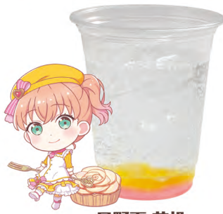
日野下 花帆 炭酸飲料 +レモンゼリー +チェリーゼリー