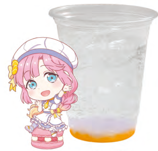
安養寺 姫芽 炭酸飲料 +グレープゼリー +みかんゼリー