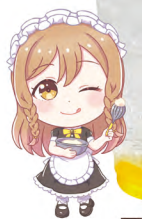
国木田 花丸 炭酸飲料 +レモンゼリー