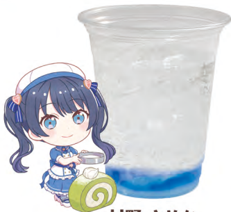
村野 さやか 炭酸飲料 +ブルーハワイゼリー +ラムネゼリー