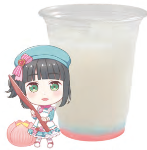
百生 吟子 乳酸飲料 +マスカットゼリー +チェリーゼリー