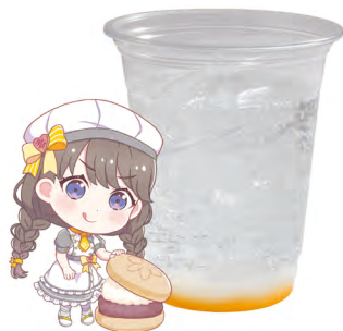
藤島 慈 炭酸飲料 +ヨーグルトゼリー +みかんゼリー