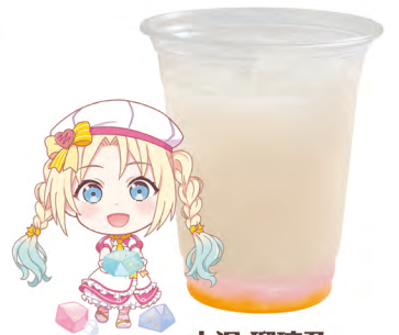
大沢 瑠璃乃 ピーチジュース +ピーチゼリー +みかんゼリー