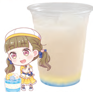
徒町 小鈴 ピーチジュース +レモンゼリー +ラムネゼリー