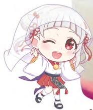
嵐 千砂都 乳酸飲料 +チェリーゼリー +グレープゼリー