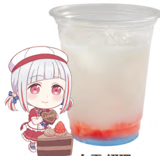
夕霧 綴理 乳酸飲料 +ストロベリーゼリー +ラムネゼリー