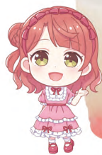
上原 歩夢 ピーチジュース +ピーチゼリー