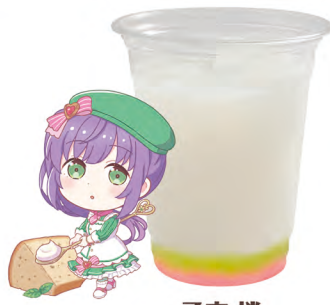
乙宗 梢 乳酸飲料 +マスカットゼリー +チェリーゼリー