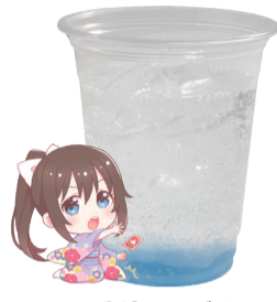
桜坂 しずく 炭酸飲料 +ラムネゼリー