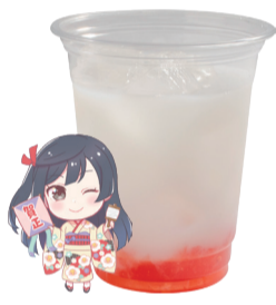
優木 せつ菜 乳酸飲料 +ストロベリーゼリー アレルギー:乳