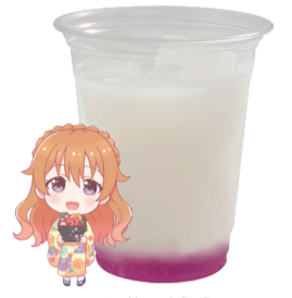
近江 彼方 乳酸飲料 +グレープゼリー アレルギー:乳