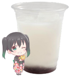
高咲 侑 乳酸飲料 +コーラゼリー アレルギー:乳