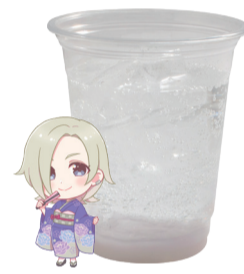
ミア・テイラー 炭酸飲料 +ヨーグルトゼリー アレルギー:乳