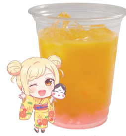
宮下 愛 オレンジジュース +チェリーゼリー