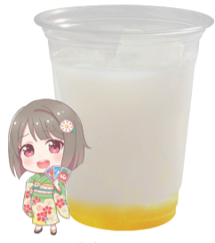
中須 かすみ 乳酸飲料 +レモンゼリー アレルギー:乳