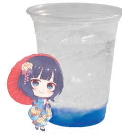
朝香 果林 炭酸飲料 +ブルーハワイゼリー