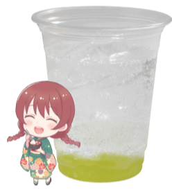
エマ・ヴェルデ 炭酸飲料 +マスカットゼリー