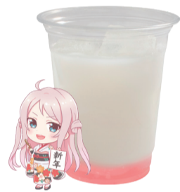
鐘 嵐珠 乳酸飲料 +チェリーゼリー アレルギー:乳