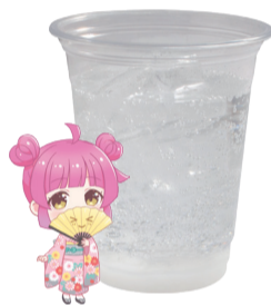
天王寺 璃奈 炭酸飲料 +ヨーグルトゼリー アレルギー:乳