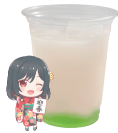
三船 凜子 ピーチジュース +マスカットゼリー