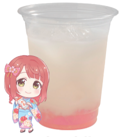
上原 歩夢 ピーチジュース +ピーチゼリー