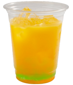
ニジガク 3年生 オレンジジュース +マスカットゼリー +みかんゼリー