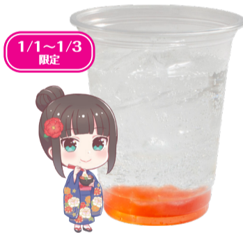
黒澤 ダイヤ 炭酸飲料 +ストロベリーゼリー