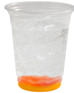
ニジガク 2年生 炭酸飲料 +ストロベリーゼリー +みかんゼリー