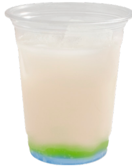
Aqours 3年生 ピーチジュース +マスカットゼリー +ラムネゼリー