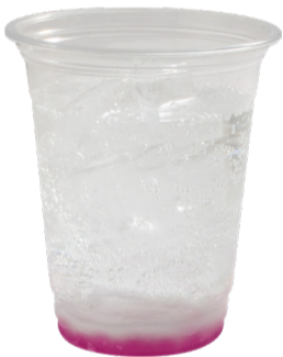
Liella! 炭酸飲料 +ヨーグルトゼリー +グレープゼリー アレルギー:乳