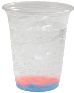
Aqours 2年生 炭酸飲料 +チェリーゼリー +ラムネゼリー