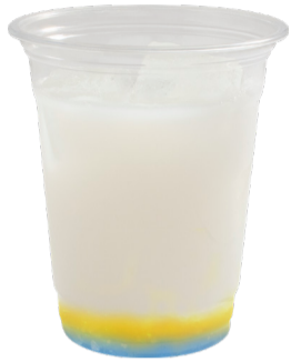
Aqours 1年生 乳酸飲料 +レモンゼリー +ラムネゼリー アレルギー:乳